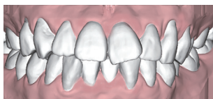
Zu geringes Platzangebot